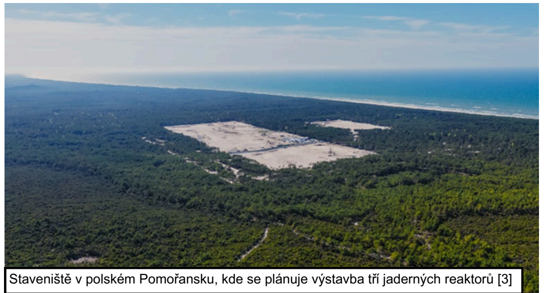
Staveniště v polském Pomořansku, kde se plánuje výstavba tří jaderných reaktorů [3]

naplánováno na rok 2036, přičemž zbylé dva budou následovat v letech 2037 a 2038. Společnost PEJ aktuálně usiluje o to, aby do konce roku 2026 podepsala hlavní dodavatelskou smlouvu s konsorciem firem Westinghouse a Bechtel. V návaznosti na tyto kroky navíc již v březnu 2026 podala formální žádost o stavební povolení. Pro Polsko, jehož výroba elektřiny je v rámci Evropské unie nejvíce závislá na uhlí, představuje jaderná energetika hlavní cestu k dekarbonizaci a zajištění dlouhodobé energetické nezávislosti. Vláda rovněž plánuje v roce 2027 vybrat technologického partnera pro svoji druhou plánovanou elektrárnu. Paralelně s tím se navíc rozvíjí plány na malé modulární reaktory, o jejichž státní podporu nedávno požádala společnost Orlen Synthos Green Energy. [5]