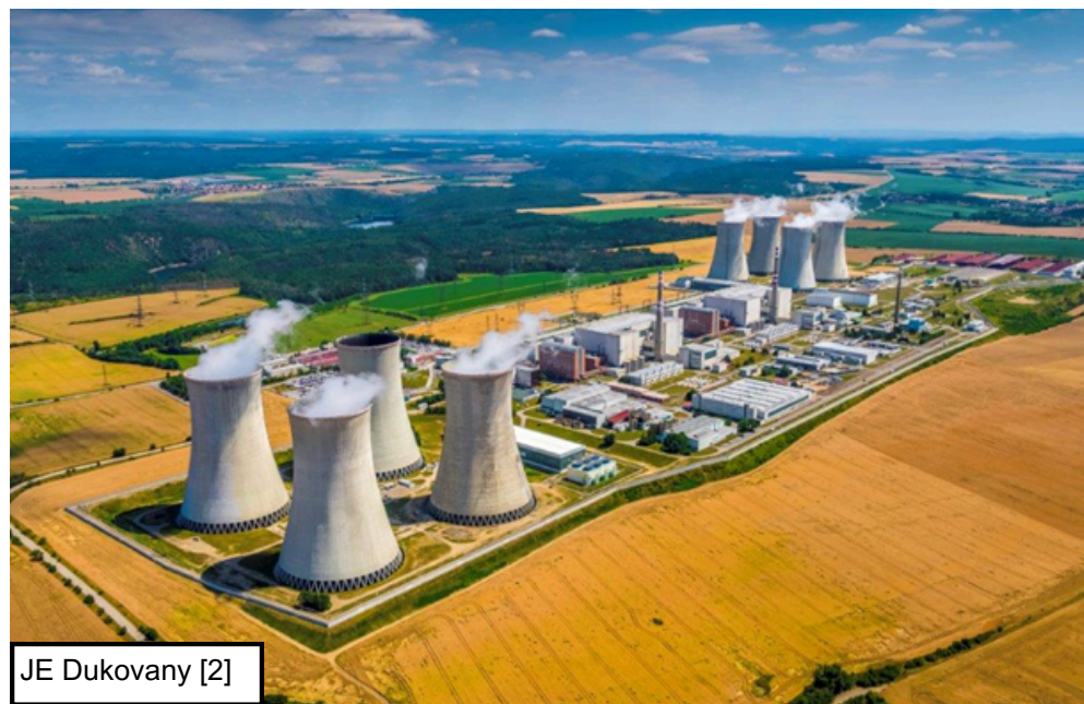
JE Dukovany [2]