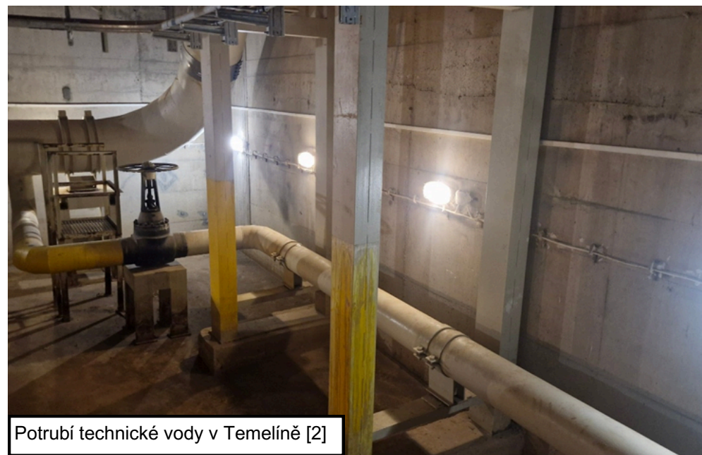
Potrubí technické vody v Temelíně [2]

V Jaderné elektrárně Temelín pokračuje rozsáhlá modernizace systému technické vody, při níž technici postupně nahrazují původní potrubí z uhlíkaté oceli novým nerezovým potrubím. Bezpečnostní potrubí propojuje výrobní bloky, bazény s technickou vodou a dieselgenerátory a jeho úkolem je zajistit spolehlivý odvod tepla z reaktoru při mimořádných provozních stavech. Projekt byl zahájen v roce 2024 a jeho dokončení je plánováno na rok 2030. Celkem bude vyměněno přibližně 350 metrů potrubí, přičemž část prací lze provádět pouze během plánovaných odstávek bloků. Výměna probíhá v podzemních chodbách elektrárny, kde sedmičlenný tým společnosti ČEZ Energioservis manipuluje s potrubními díly o hmotnosti až 300 kilogramů pomocí kladkostrojů a speciálního lešení. Práce v uzavřených prostorách vyžadují přísná bezpečnostní opatření včetně