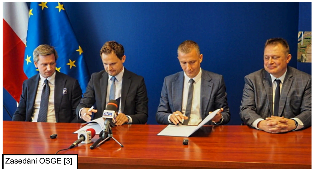
Zasedání OSGE [3]

potřebná pro pokračování přípravných prací a ve Włocławku probíhají environmentální a lokalizační průzkumy, které mají sloužit jako podklad pro budoucí žádost o stavební povolení. Společnost uvádí, že projekt přinese regionu nové pracovní příležitosti i daňové příjmy a může podpořit příchod energeticky náročných investic, například datových center. Reaktor BWRX-300 od společnosti GE Vernova Hitachi Nuclear Energy je varný reaktor s elektrickým výkonem 300 MWe využívající pasivní bezpečnostní systémy. Referenčním projektem pro polské plány je výstavba čtyř reaktorů BWRX-300 v kanadském Darlingtonu, kde byla výstavba první jednotky schválena v roce 2025 a její uvedení do provozu se plánuje na konec desetiletí. [5]