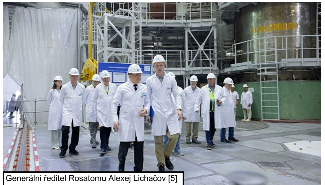
Generální ředitel Rosatomu Alexej Lichačov [5]

Na prvním bloku turecké jaderné elektrárny Akkuyu byla zahájena důležitá etapa uvádění do provozu – studené hydraulické testy. Jejich spuštění následovalo po dokončení stavebních prací a nedávném zavedení maket palivových souborů do reaktoru. Testy mají ověřit připravenost zařízení před přechodem do závěrečných fází spouštění elektrárny. Během studených hydraulických zkoušek odborníci kontrolují těsnost a pevnost primárního okruhu, provádějí jeho proplachování, ověřují chemické vlastnosti vody a sledují, zda se jednotlivé systémy chovají podle projektových parametrů. Po jejich dokončení budou následovat horké testy, při nichž budou systémy pracovat za podmínek blížících se běžnému provozu, včetně zkoušek hlavních cirkulačních čerpadel při