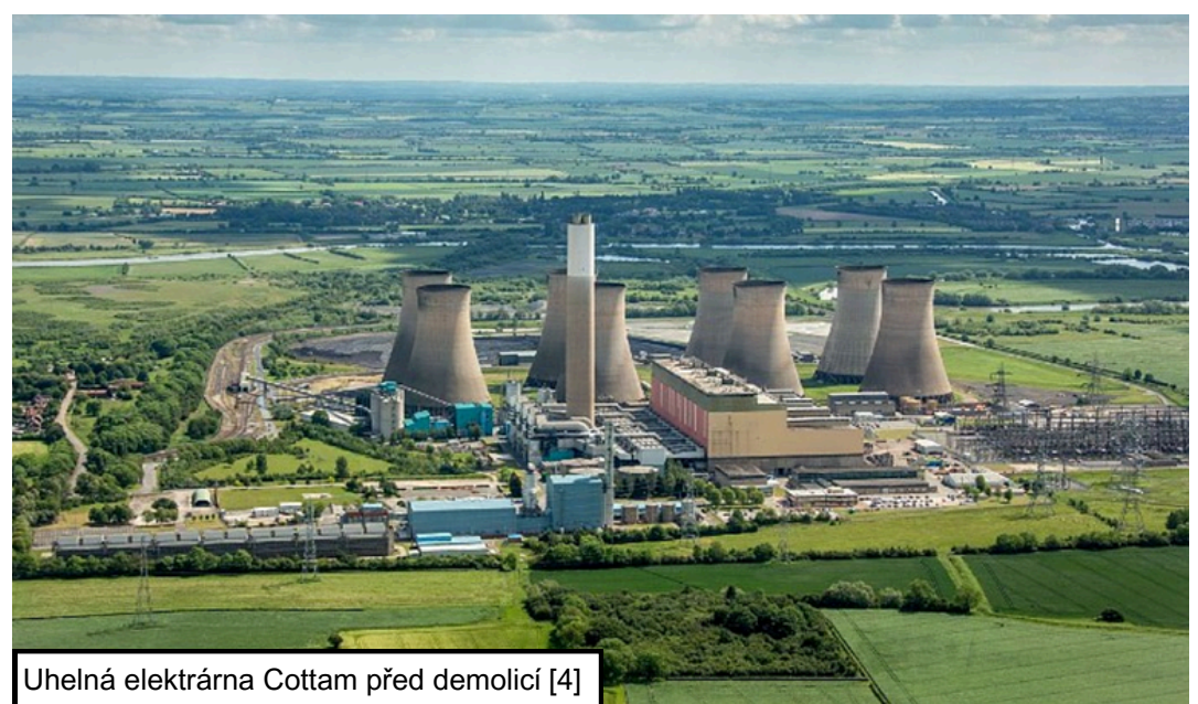
Uhelná elektrárna Cottam před demolicí [4]

britského procesu hodnocení, během které regulátoři nenašli žádné zásadní bezpečnostní ani environmentální překážky pro jeho možné nasazení. Před zahájením výstavby však bude nutné dokončit další podrobné posouzení konkrétní lokality. Projekt v Cottamu by se měl stát druhou realizací reaktoru SMR-300 po připravované výstavbě dvou bloků v americké elektrárně Palisades. SMR-300 je tlakovodní reaktor produkující přibližně 300 MW elektrického výkonu nebo 1050 MW tepelného výkonu pro procesní aplikace. Holtec zároveň oznámil, že plánuje výrazně rozšířit své aktivity ve Spojeném království, včetně zvažované výstavby výrobního závodu na jaderná zařízení. Výstavba v Cottamu by zároveň podpořila přeměnu bývalé uhelné lokality na nové centrum nízkoemisní energetiky a moderního průmyslu. [6]